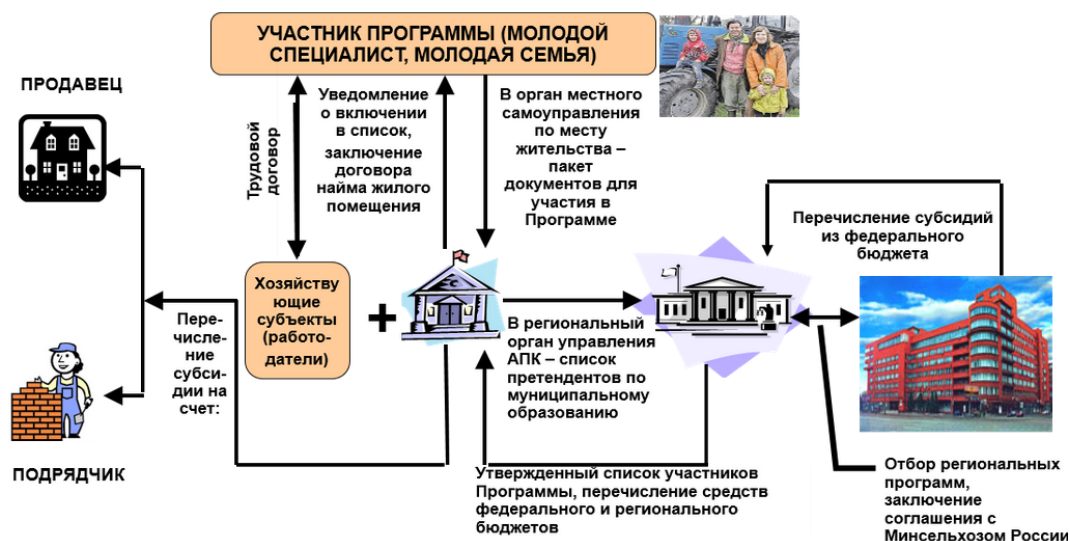
Схема предоставления субсидий на софинансирование расходных обязательств муниципальных образований на строительство (приобретение) жилья, предоставляемого молодым семьям и молодым специалистам по договору найма жилого помещения

В случае привлечения гражданином для строительства (приобретения) жилья в качестве источника софинансирования жилищного кредита (займа), в том числе ипотечного, социальная выплата может быть направлена на уплату первоначального взноса, на погашение основного долга и уплату процентов по кредиту (займу) при условии признания гражданина на дату заключения соответствующего кредитного договора (договора займа) имеющим право на получение социальной выплаты.