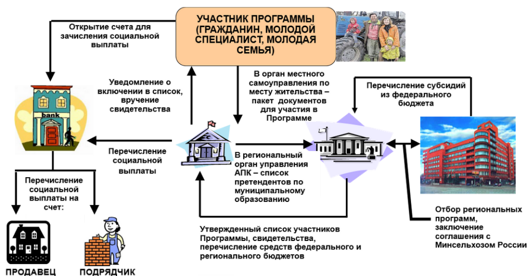
Схема предоставления социальной выплаты на строительство (приобретение) жилья

Преимущественное право на получение социальной выплаты имеют работающие в организациях агропромышленного комплекса, а также изъявившие желание улучшить жилищные условия путем строительства жилого дома (квартиры)