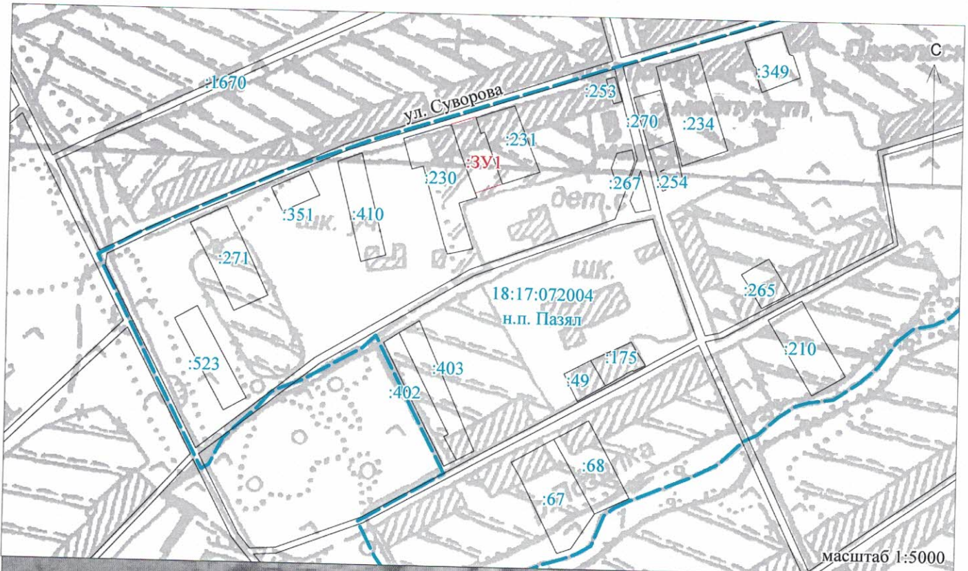
Схема расположения земельного участка или земельных участков на кадастровом плане территории.