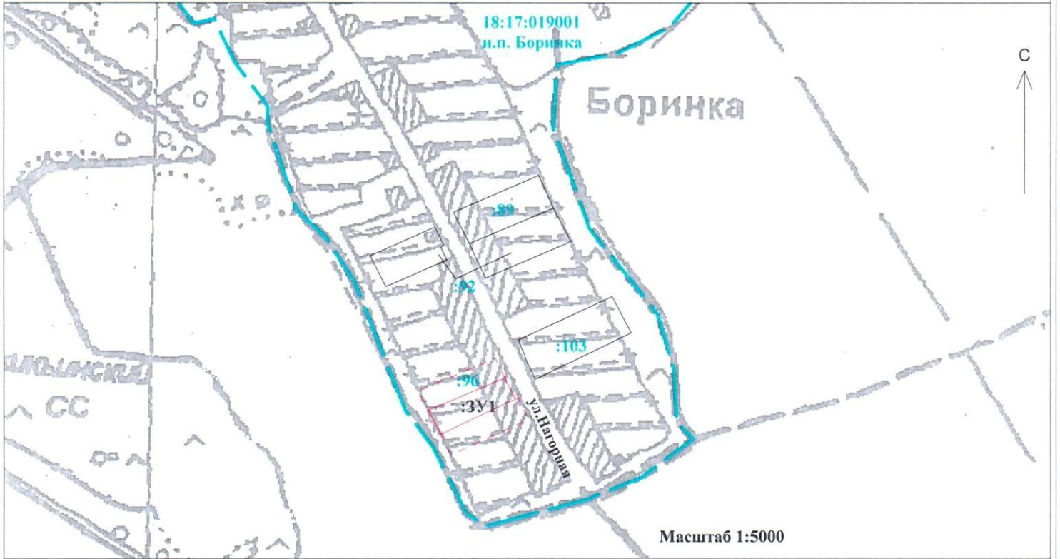
Схема расположения земельного участка на кадастровом плане территории