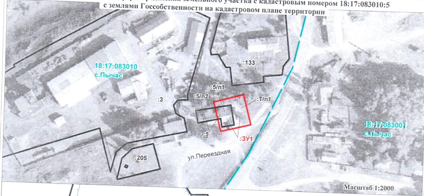
Схема расположения земельного участка с условным обозначением :ЗУ1, образованного путем перераспределения земельного участка с кадастровым номером 18:17:083010:5 с землями Госсобственности на кадастровом плане территории