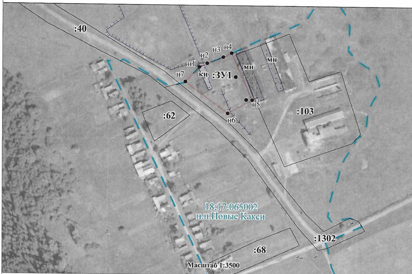
Схема расположения земельного участка на кадастровом плане территории